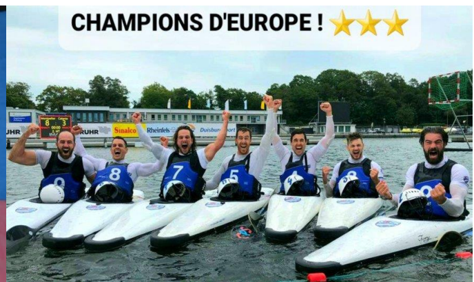
le club de 3MCK-UC