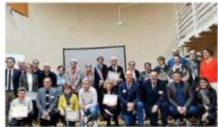
Les bénévoles honorés et médaillés.