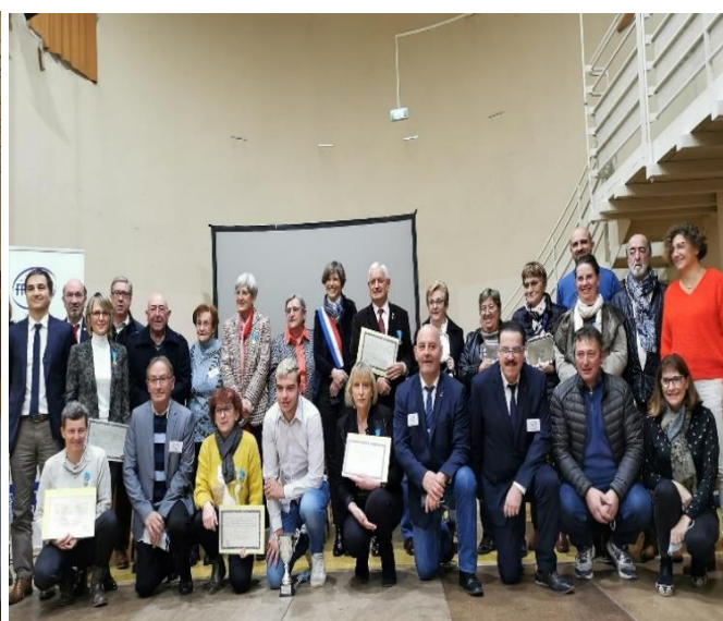
Tous les récipiendaires de la journée du 4 décembre