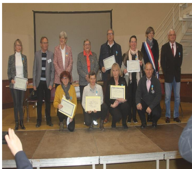
Les médaillés ministériels bronze et argent